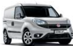
Grigio chiaro 612