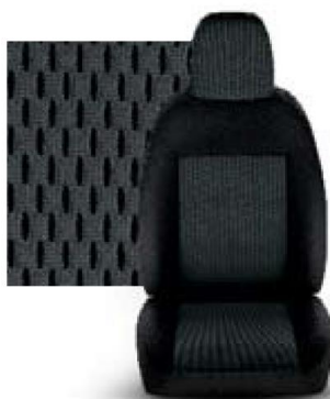
STAR GREY 213